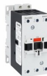
Stycznik mocy BF40